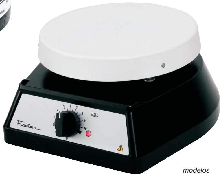
modelos 752, 753 e 754