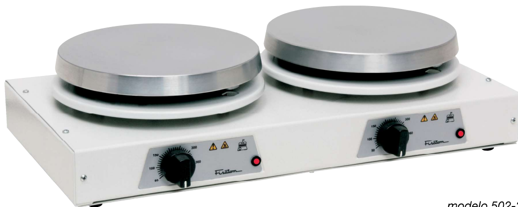
modelo 502-2 e 503-2